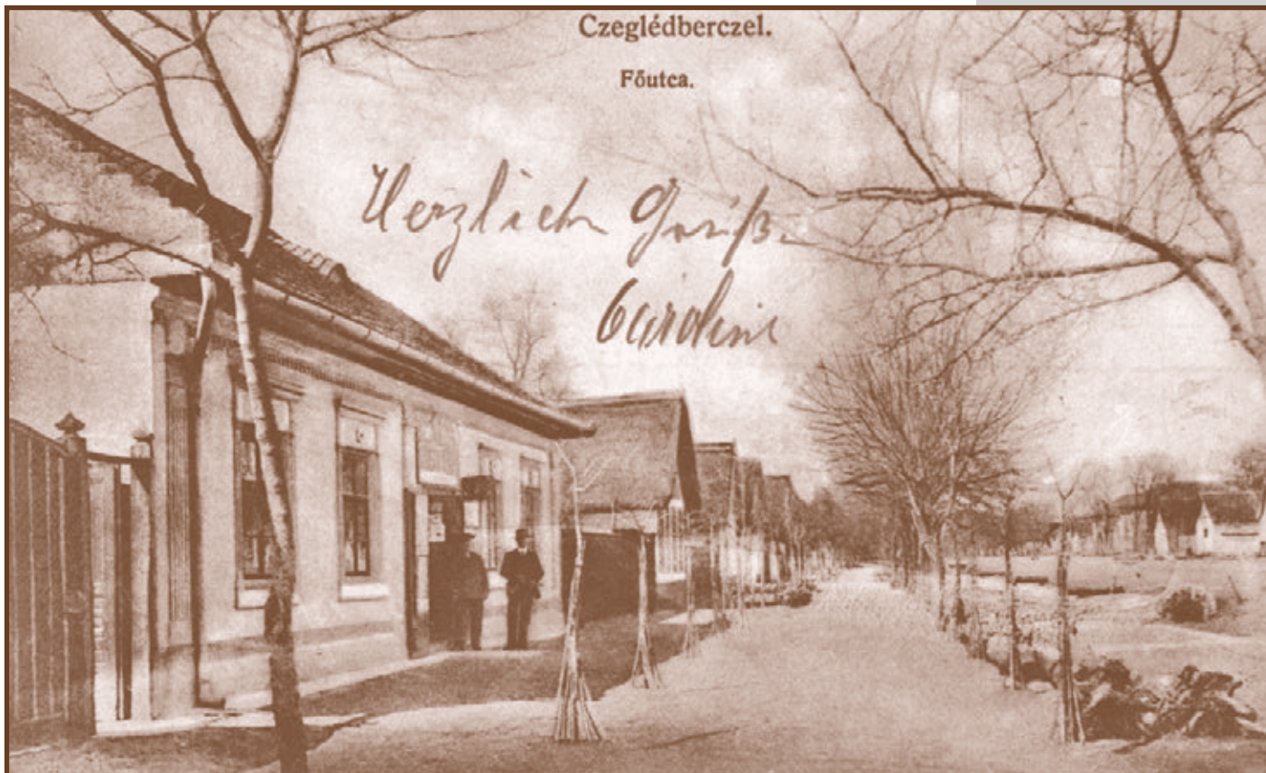
Ceglédbercel Fő-utca 1900 körül 1910-es években készítette Gyeness István Fűszerkereskedő a képeslapot